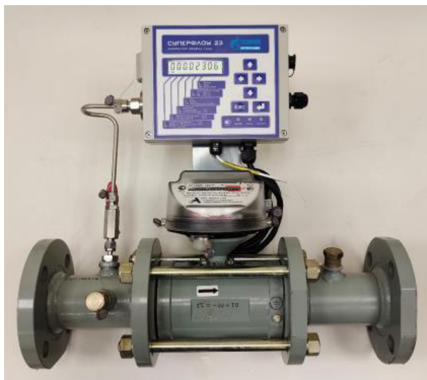
Рисунок 2 – Общий вид комплексов измерительных Суперфлоу 23СГ