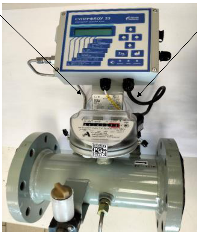
Рисунок 1 – Общий вид комплексов измерительных Суперфлоу 23СГ с указанием мест нанесения знака утверждения типа и заводского номера